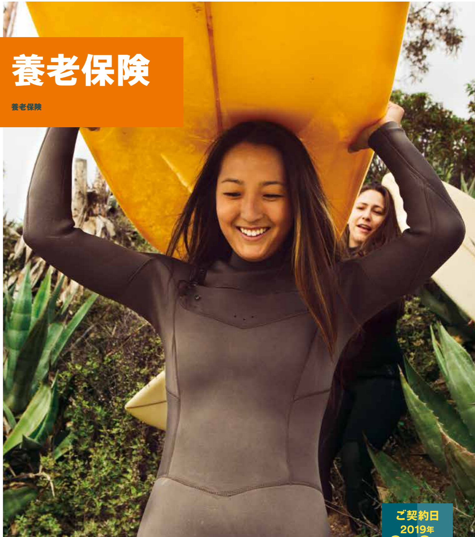
養老保険 | 2019年9月改訂